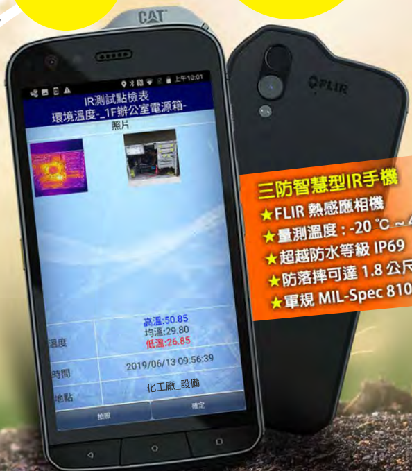
▲智慧裝置操作APP實際畫面